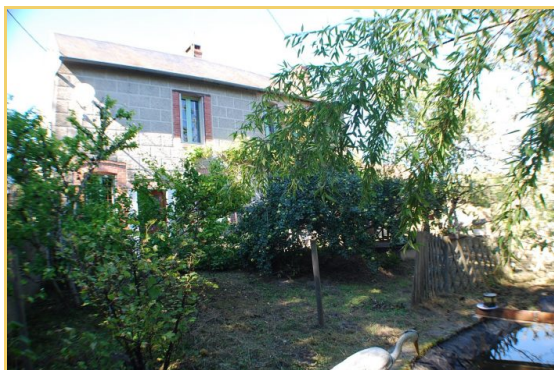
Coup de cœur